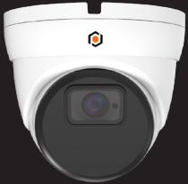
TEBFDAIP8MP28-AI CAMÉRA SÉRIES T