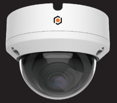
D2FDA28IP5MP-AI CAMÉRA SÉRIES D