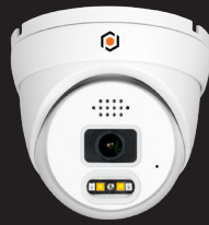
XEBATVI8MP28-AI-64G CAMÉRA SÉRIES X