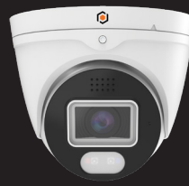
XSEBATVIP4MP28-AI CAMÉRA SÉRIES X