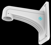
WMB6 SUPPORT DE MONTAGE AU PLAFOND