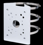
PMB6 SUPPORT POUR POTEAU