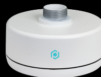
EB3BASE6-G SUPPORT MURAL