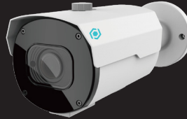
B7Z2812AIO-5MP B SERIES CAMERA