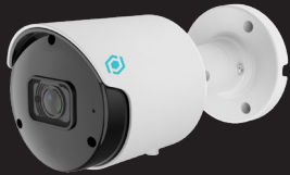
B2F28AIO-5MP-M B SERIES CAMERA